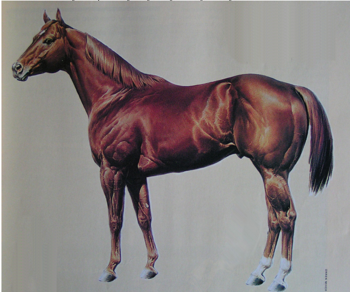
idealni quarter konj

In kako izostriti svoje oko pri ocenjevanju konjeve konformacije?